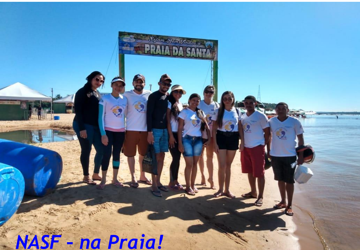
NASF - na Praia!