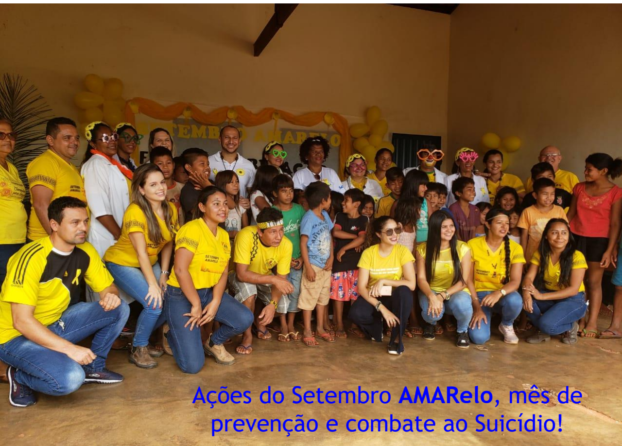
Ações do Setembro AMARELO, mês de prevenção e combate ao Suicídio!